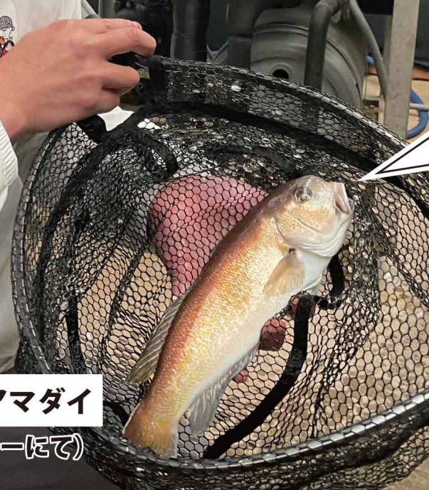
人工ふ化に成功したシロアマダイ (3月：山口県水産研究センターにて)

仙崎大泊地区にある山口県水産研究センターでは、研究員の皆様のご努力により、困難な採卵用の天然魚確保の課題を乗り越え、全国で初めて人工ふ化したシロアマダイの養成魚からの採卵・種苗生産に成功。市場でも高値で取引されるシロアマダイの種苗生産技術に今後さらに磨きをかけ、日本海での漁獲増にも取り組んでいきます。